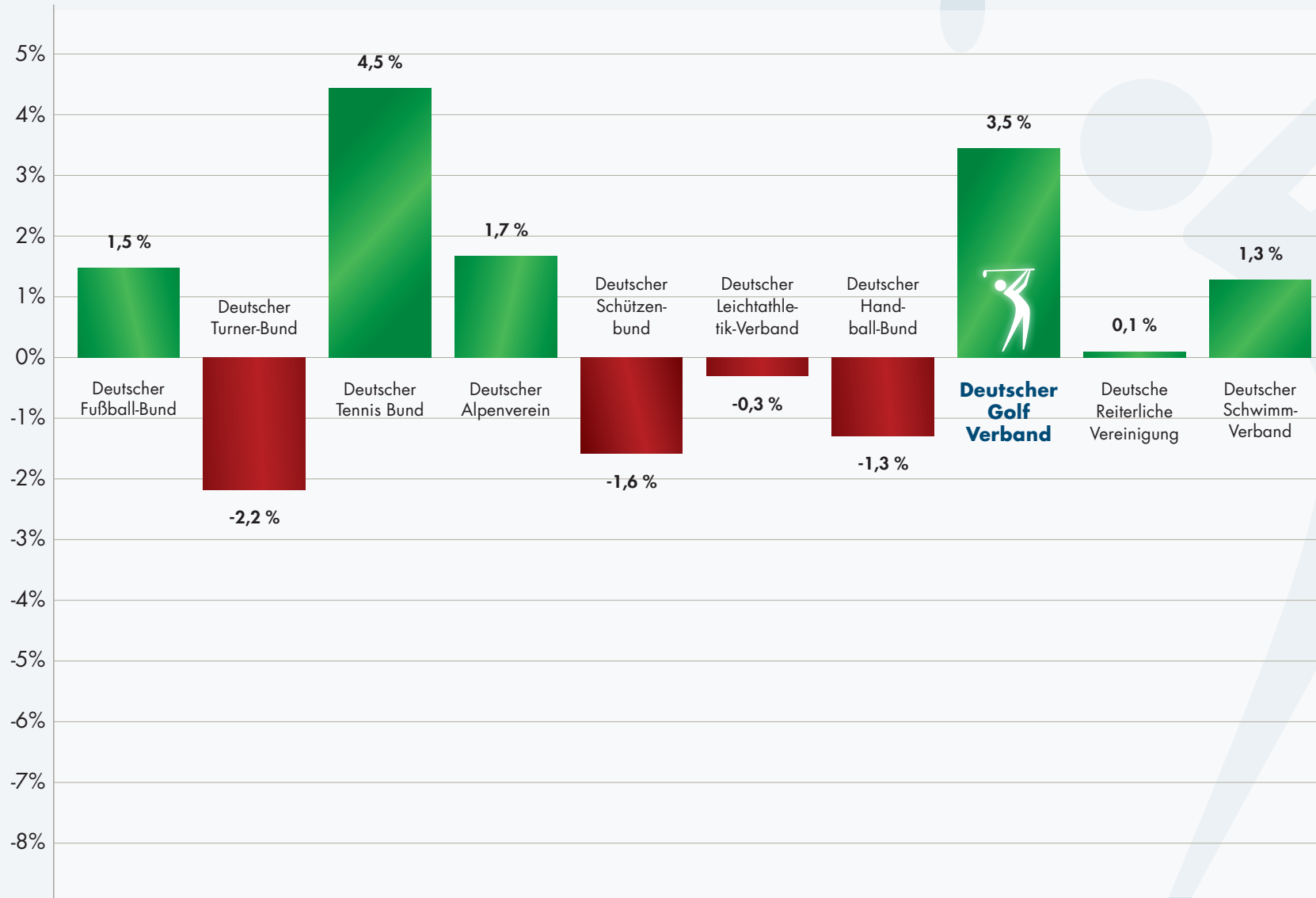
Zu- und Abgänge prozentual

Anmerkungen: Der Deutsche Olympische Sportbund (DOSB) hat die Daten zum 1. Januar 2022 erhoben und im letzten Quartal 2022 veröffentlicht. Die hier aufgeführten Zahlen beziehen sich daher auf das Jahr 2021.